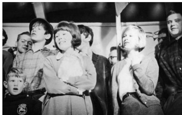
Juniorer på scenen til juniorrevyen.

Den store succes havde også sin pris. Pladsen var trang i Barakken, og der var derfor ikke plads til koret, som bestod af ældre juniorer. Problemet blev løst ved, at koret forinden havde indspillet sit repertoire på en gammel båndafspiller. Båndafspilleren var af ældre dato og brugte i kassetten ikke plasticbånd men derimod ståltråd som havde det med at knække med