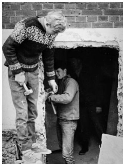
Nogle af de yngre medlemmer igang med at hugge ud til kælderdøren.

Alle frivillige blev inddelt i arbejdsgrupper alt efter deres uddannelse eller hvordan de havde hænderne skruet sammen, således at tømrerne og sned-