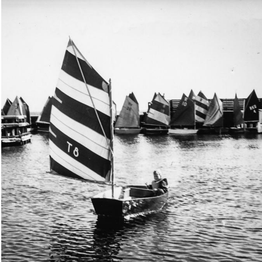
Optimistkapsejls i Taarbæk i 1958.