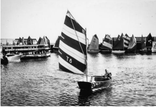
Optimistkapsejlads i Taarbæk i 1958.

ladsbanerne var dog ikke kun begrænset til Nordiske Krydsere, for også juniorbådene og folkebådene begyndte i den periode at bide fra sig. Det var i det hele taget i denne periode, at Taarbæk Sejlklub så småt indtrådte i hvad mange kalder klubbens storhedstid.