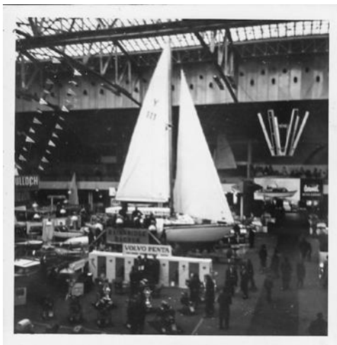
Jettebeth IV på bådudstillingen i Forum.

Anskaffelsen af de nye moderne havkrydsere betød også lidt af et boust for juniorafdelingen, for med de nye både fik juniorerne mulighed for at lære at sejle så store både. Det var en helt unik chance for træning, som kun de færreste juniorer i landet kunne drømme om.