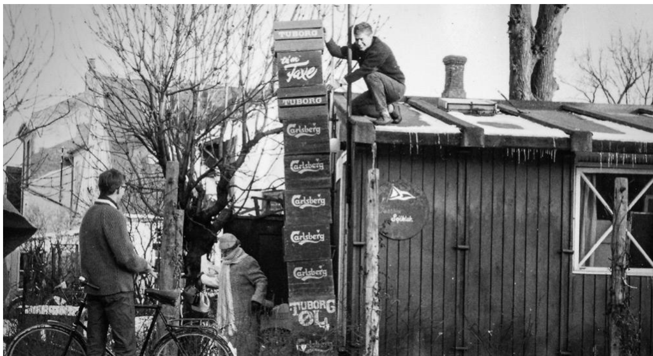
Det føste klubhus "Barakken". De mange ølkasser er ikke rester fra en fest, men skal bruges som scene til juniorrevyen.

fra en kvindelig hånd. Taarbæk Sejlklub kom med løsningen i 1962, hvor der blev arrangeret kokkekursus en gang om ugen i et halv år. Man havde fra klubbens side "tænkt sig at adskillige medlemmer ville være glade for at få kendskab til elementær madlavning til brug i forbindelse med deltagelse i havkapsejlads". Indbydelsen blev trykt i Taarbæk Sejlklubs spalte i det landsdækkende Sejl og Motor. Det vides ikke, hvordan kurset gik, men det er alligevel svært at slippe scenen fra filmen Amatører til Søs, hvor der trænes madlavning i høj søgang i en hængekøje.