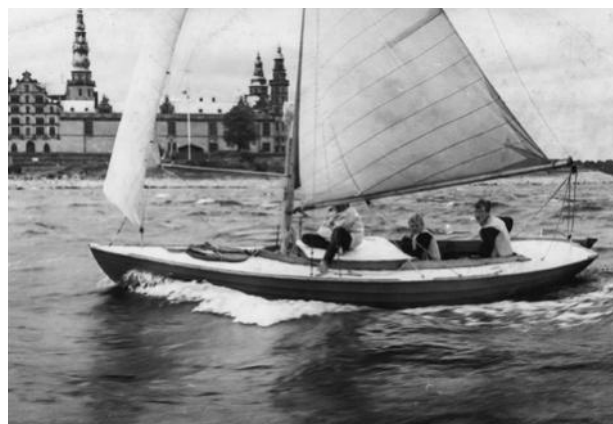
En af klubbens juniorbåde med Kronborg om styrbord.

Klokken var 7 da vi vendte sidste gang før indløbet til Lohals. Færgeren fra Sydfyenske Dampskibsselskab var lige kommet ind fra Korsør og der var folk på kajen med trækvogne og cykler for at tage imod. En enkelt kutter stod ud med sin karakteristiske Tuxham-Tuxham-Tuxham dunken (eller var det en Grenå diesel?). Bøgetræerne stod stadig lyst grønne i morgenlyset, og man kunne høre båndsaften fra bådebyggeriet nord for havnen. Børn og piger i lyse kjoler. Og der skulle ligge en bager lige bag købmands-